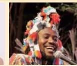
ベノワ・ミロゴ (パーカッション)