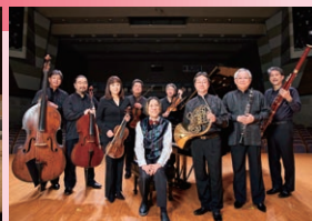
2023年KOBELCO大ホール公演より