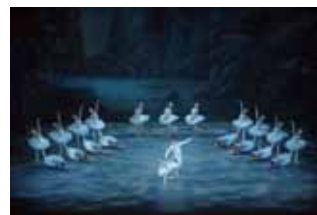
東京シティ・バレエ団『白鳥の湖』第4幕 撮影：鹿摩隆司

© Fondation Fujita / ADAGP, Paris & JASPAR, Tokyo 2018