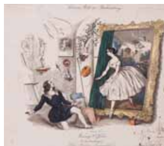
ファニー・エルスラー『画家の譎妄』1843年頃 アンティークプリント