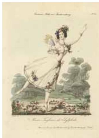
マリー・タリオニ『ラ・シルフィード』1833年頃 アンティークプリント