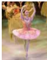
『くるみ割り人形』