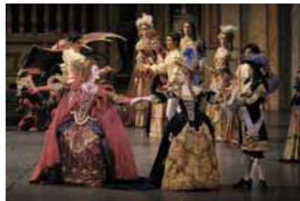
『眠れる森の美女』