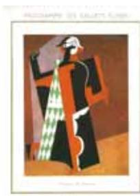
パブロ・ピカソ表紙デザイン 『バレエ・リュス公式プログラム』 パリ・シャトレ座 1917年