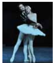
『白鳥の湖』