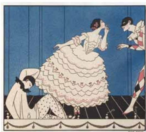
ジュール・バルビエ版画『ル・カルナヴァル』より「クラウンとコロンビーヌとアルルカン」1914年